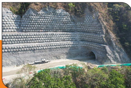
PORTAL SALIDA TÚNEL 2