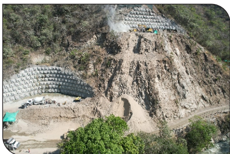
CIELO ABIERTO 4