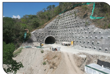
PORTAL ENTRADA TÚNEL 1