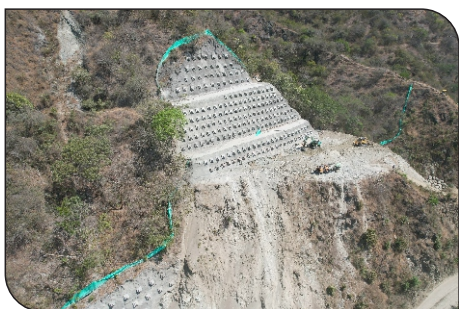
CIELO ABIERTO 3B