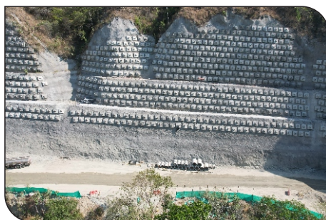
CIELO ABIERTO 5